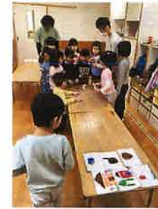
子どもたちがいるところがスタートとなり家が置いているところまで目指して、20から30回ほどヘビを動かすたびに写真を撮りました。