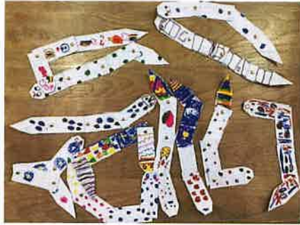
子どもたちがそれぞれ自分の描きたい模様を描いたヘビです。個性豊かなヘビになりました。