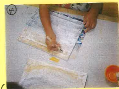
④ 水をかけた絵筆でなぞると、じわ〜とキットパスがしみ色が広がりました。ビックリ!