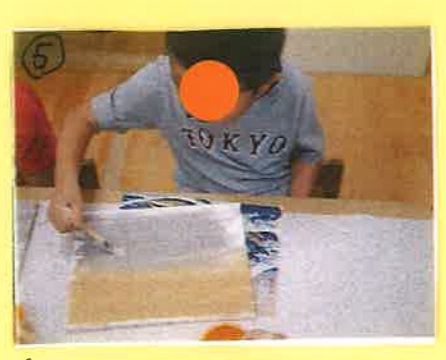
⑤ しっかりと水でぬらしていきます!