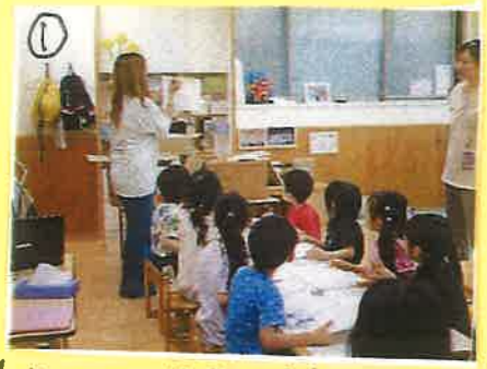
① まっちゃん先生の話をしっかりと聞いています! 楽しみワクワクで真剣です!

[自然との関わり・生命尊重] [言葉による伝え合い] [豊かな感性と表現] [自覚心] [社会生活との関わり] [思考力の芽生え]