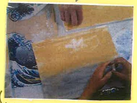
⑥ 白のキットパスでぼんやりとした雲を描きます。