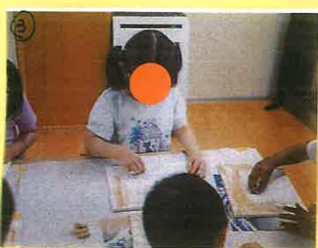
③ キャンパスはいいぬっていきよ〜!!