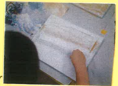
② 見本を見ながら背景の色の塗り分けをしました。薄くぬり塗りしっかり塗り様々です!