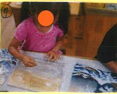
⑦ 白のキットパスで波の水しぶきも描いていきます。