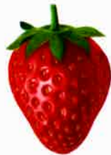
Strawberry ストウロオーベリイ