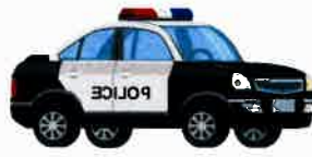
Police Car パトリース カー