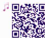
Fruit Song by The Singing Walrus