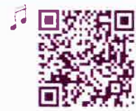
Fruit Finger Family by Bounce Patrol