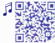
The Wheels On The Bus by Super Simple Songs